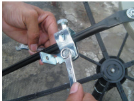
9. ชันน็อตให้แน่น