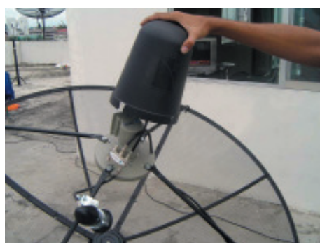
29. นำหมวกครอบ LNB มาใส่กับสกลาล์วริง โดยให้ DiSEqC 4x1 อยู่ภายในหมวก