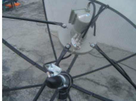
28. ทำการเก็บสายนำสัญญาณให้เรียบร้อย และใช้เทปพันละลายพันที่จุดต่อ F-Type ของ LNB KU เพื่อป้องกันน้ำเข้า