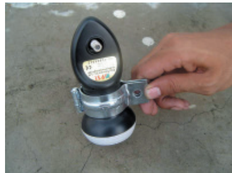
12. เมื่อเปิดขาจับ LNB จะต้องมียช่องว่าง เพื่อให้ได้รััดให้แน่น