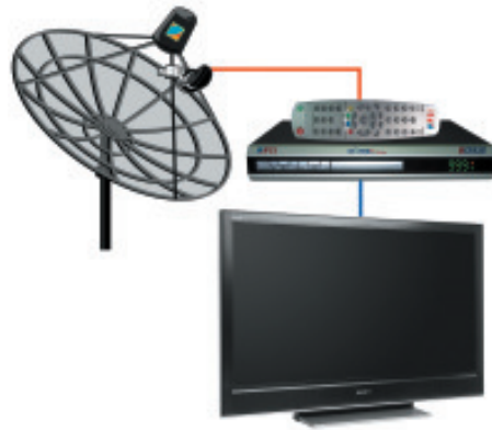
17. ทำการต่อสายนำสัญญาณกับเครื่องรีซีฟเวอร์ และทีวี