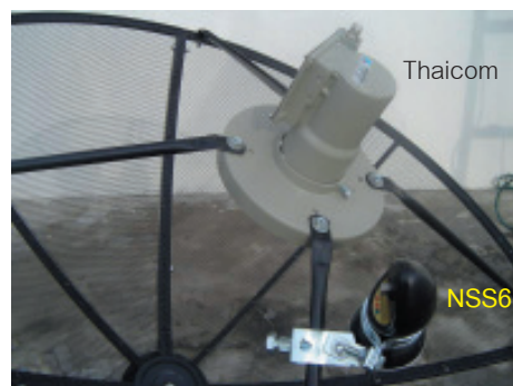
23. LNB ตัวใหญ่จะรับดาวเทียม THAICOM ส่วน LNB ตัวเล็กจะรับดาวเทียม NSS 6