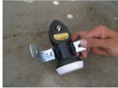
11. นำขาจับมาใส่กับตัว LNB