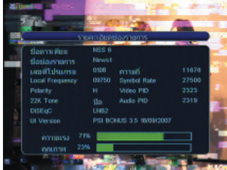
19. กดปุ่ม INFO โดยปกติแล้วหากมีการต่อถูกต้อง เปอร์เซ็นต์ของคุณภาพ จะต้องมีมากหรือน้อยขึ้นอยู่กับตำแหน่งที่ตั้ง LNB KU (K3) ว่าถูกต้องหรือไม่