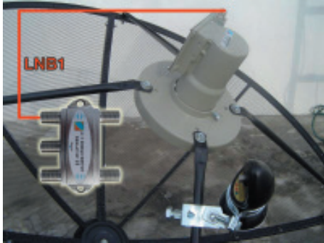
25. LNB C-Band ต่อเข้ากับ DiSEqC 4x1 ในช่อง LNB1