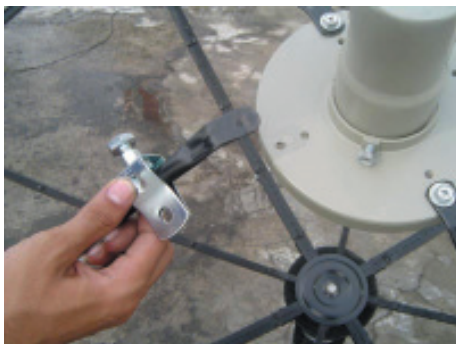
3. นำชุดยึดก้านพืดของ LNB KU มาใส่เข้ากับก้านพืด