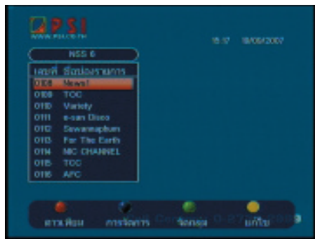
18. เปิดเครื่องรับไปที่ดาวเทียม NSS6 ช่องรายการ News1