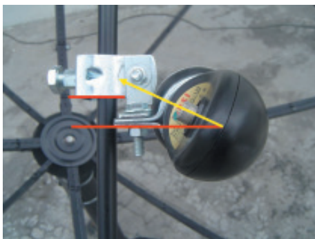
15. ปรับโฟลวไรท์ LNB KU ให้ชี้ F-TYPE เียง 45 องศา ( ตามเส้นสีเหลือง )