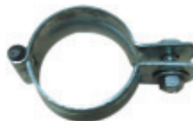
ชุดอุปกรณ์ยึด LNB KU-Band