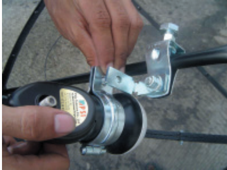
13. นำขาจับพร้อม LNB มาประกอบกับเหล็กฉาก รูปตัว L