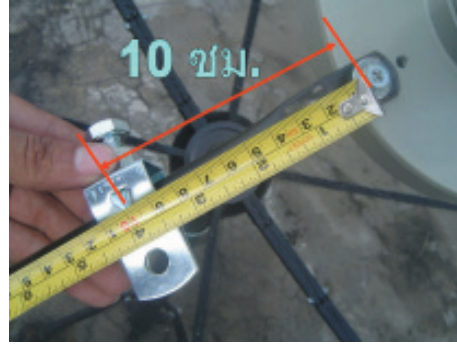
5. ใช้ตลับเมตรวัดจากหัวสกรู ไปยังตำแหน่งมาร์คให้ได้ระยะ 10 ซม. สำหรับจานดาวเทียม D1.3 ส่วนจานดาวเทียมรุ่น D2 ยาว 19 ซม. , D1.7 ยาว 16 ซม. และ D1.5 ยาว 13 ซม.