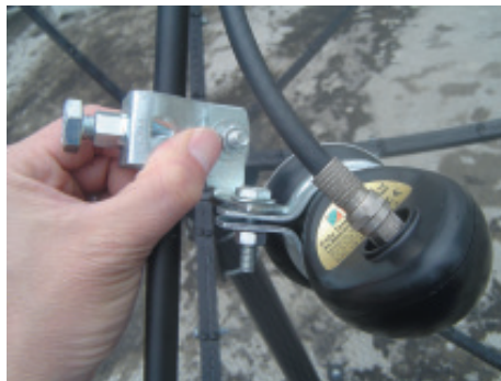
20. ปรับชุดจับ ขึ้น หรือ ลง หาสัญญาณที่ดีที่สุด