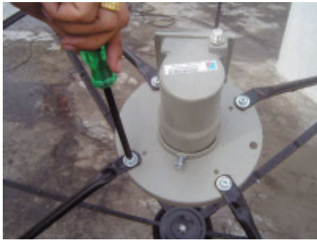
2. ใช้ไขควงถอดสกรูตำแหน่งที่ยึดก้านพืดทางซ้ายด้านล่างออก ( กรณีเรายื่นอยู่หน้าจาน )