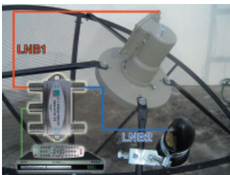
27. DiSEqC 4x1 ในช่องรีซีฟเวอร์ต่อเข้ากับเครื่อง BONUS