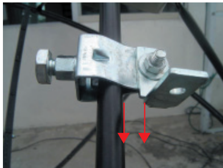
8. ปรับให้เหล็กฉากรูปตัว L ขนานกับแนวก้านพีด