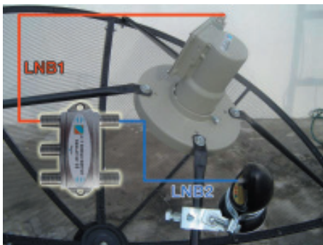
26. LNB KU-Band ต่อเข้ากับ DiSEqC 4x1 ในช่อง LNB2