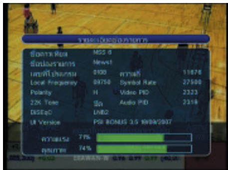
21. ในขณะที่ปรับ LNB ให้ดูเปอร์เซ็นต์ของคุณภาพ ให้ได้สูงที่สุด