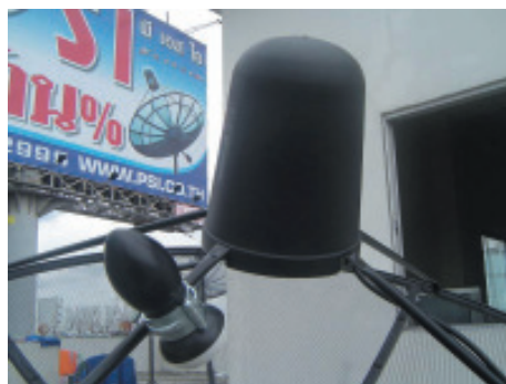
30. รูปภาพการติดตั้งที่เสร็จแล้ว