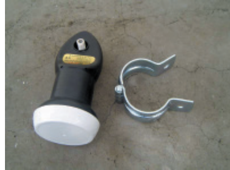
10. ตัวจับ LNB กับ LNB KU แบบ Universal รุ่น K3