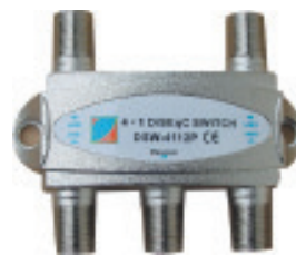
DiSEqC Switch 4x1