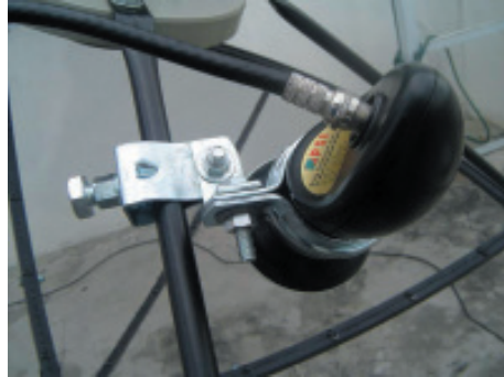
16. ต่อสายนำสัญญาณ เข้ากับตัว LNB KU