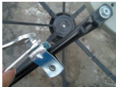
6. เมื่อได้ระยะตามต้องการ ให้ขันน็อตยึดให้แน่น