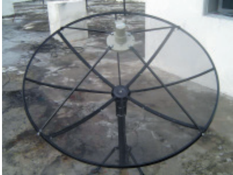
1. จานดาวเทียมที่ติดตั้งรับดาวเทียม THAICOM ได้แล้ว