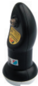
LNB KU ( K3 )