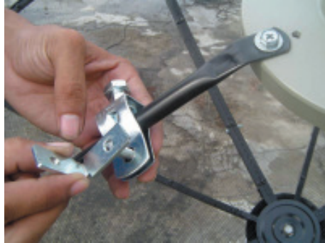
7. นำเหล็กฉากรูปตัว L มาประกอบกับชุดยึดก้านพีด