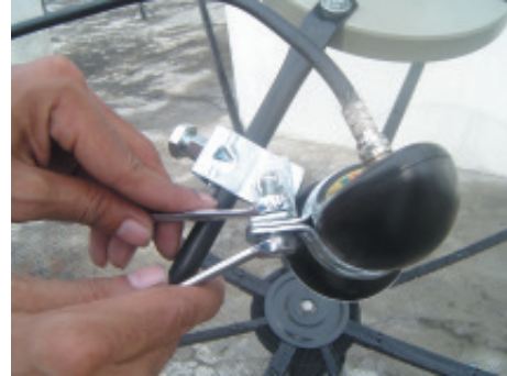
22. เมื่อได้ตำแหน่งถูกต้องแล้วทำการขันน็อตทุกตัวให้แน่น เพื่อให้ไม่ให้ LNB หมุน