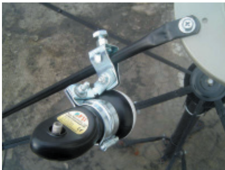
14. ให้ตัว LNB เียงเข้าไปตามแนวแกนพืด