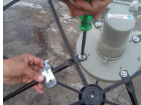
4. ใส่สกรูกลับเข้าที่เดิมด้วยไขควง